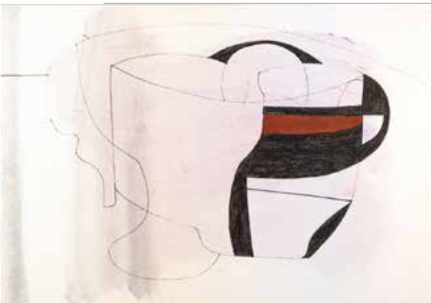
Ben Nicholson, artista inglese (1894-1982)

Tutti i programmi proposti sono stati messi a punto per permettere ai nostri studenti di raggiungere risultati concreti in poco tempo. Il metodo OISE mette al centro l'individuo e combina approcci e tecniche diverse a seconda delle esigenze del singolo. Per questo motivo OISE propone esclusivamente corsi flessibili e intensivi, organizzati in mini gruppi e/o con lezioni individuali.